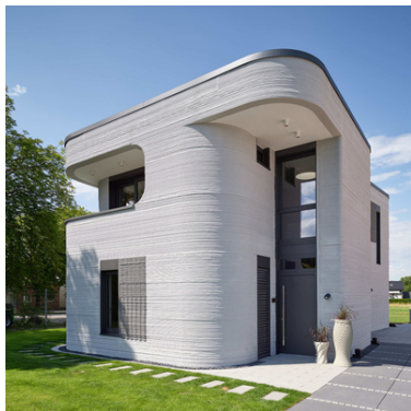
© PERI Vertrieb Deutschland GmbH & Co. KG