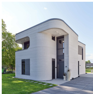
© PERI Vertrieb Deutschland GmbH & Co. KG