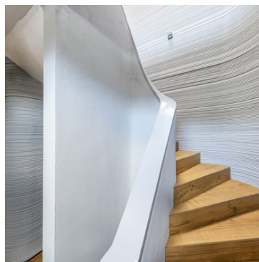
© PERI Vertrieb Deutschland GmbH & Co. KG